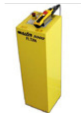
EH = centralita electrohidráulica con mando a distancia