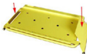
Topes exteriores e interiores para ruedas en los soportes de apoyo de ruedas