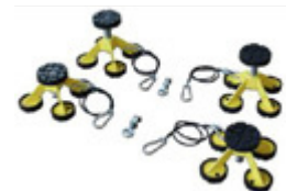
Tacos altos regulables para vehículos comerciales