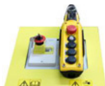
Pulsador parada de emergencia con llave contra el uso no autorizado