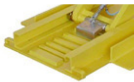
Dispositivo de seguridad mecánica elevador