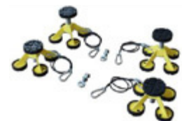
Tacos altos regulables para vehículos comerciales