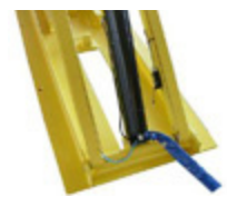
Dispositivo de seguridad inferior durante la bajada con activación de señal acústica