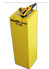
EH = elektrohydraulische Ansteuerung mit Fernsteuerung