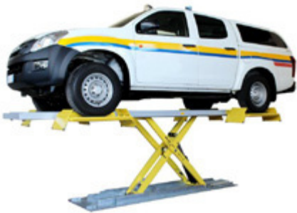
Standardheben mit Rädern auf Platten

Gleiche Aufnahme zum Anheben an den Rädern und am Schweller mit Gummiauflagen