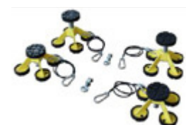
Einstellbare hohe Hubaufnahmen für Nutzfahrzeuge