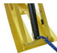
Arresto di sicurezza in discesa con attivazione del segnale acustico