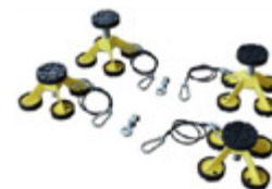
Tamponi alti regolabili in altezza per veicoli commerciali