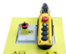
Arresto di emergenza con chiave contro l'utilizzo non autorizzato