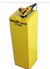
EH = centralina elettroidraulica con comando a distanza