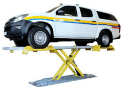
Sollevamento standard su supporti presa ruota