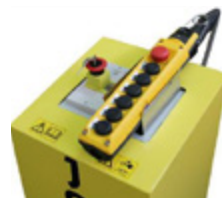
RC Fernsteuerung (optional)