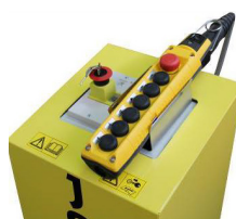
Pulsantiera "RC" (accessorio)