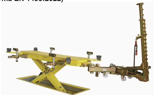
3.5TON MAXI N 10TONFL08

con blocco e sblocco automatico rotazione bracci di sollevamento (Norma EN 1493:2022)